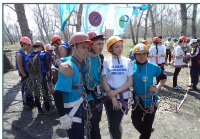
Туристік көпсайыс жарысы