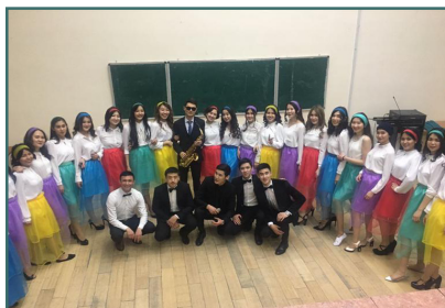
Ең үздік студенттік топ байқауы

Факультетте Студенттік кеңес, Студенттік маслихат және студенттердің «Сұңқар» кәсіподақ ұйымы сияқты студенттердің өзін-өзі басқару ұйымдары қызмет көрсетеді. Басқа қалалардан келген студенттер жатақханамен қамтамасыз етіледі.