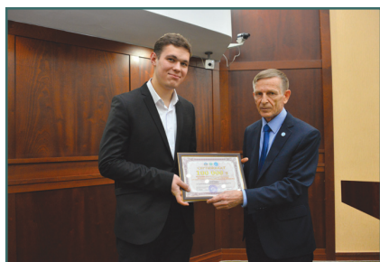
Ғылыми конференция жеңімпазы