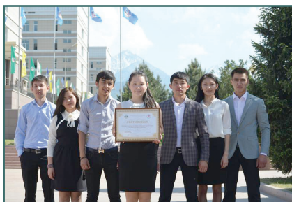
Халықаралық ғылыми конференция жеңімпаздары