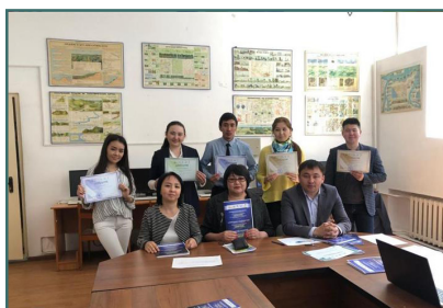
Студенттік ғылыми жұмыстар байқауы